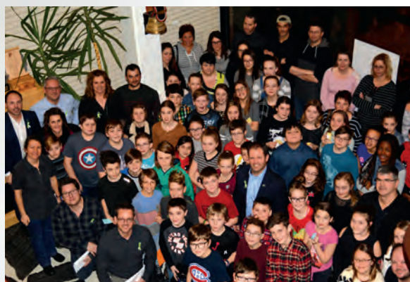
Le conseil municipal a reçu les élèves de 5 e et 6 e année de l'école Sacré-Cœur lors d'une séance publique.