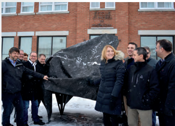
Dévoilement du 1 er legs du 125 e anniversaire de la Ville : un beau piano urbain inauguré devant le Complexe culturel Saint-Michel.