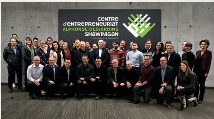
Une délégation du milieu visite Shawinigan, exemple de concertation en développement économique